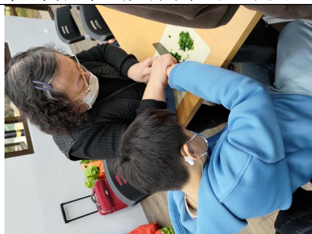
照片簡述： 學生由長輩教學，使學生了解長輩相處時的應對進退。