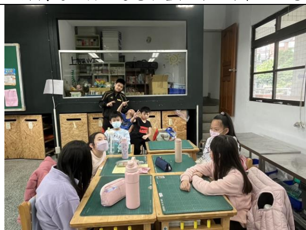
照片簡述：討論與自己性格相同的人的特質