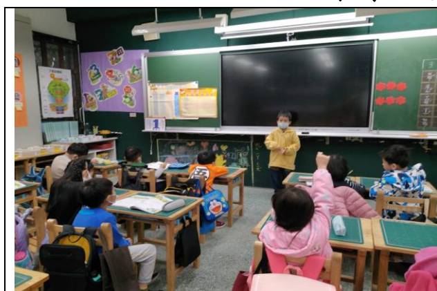
照片簡述：與同學分享最拿手的家事