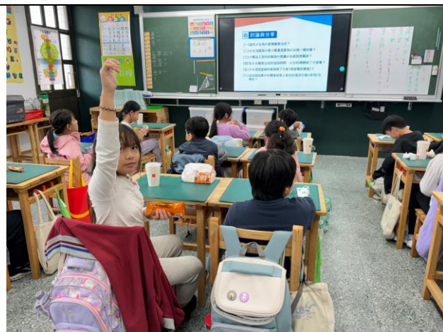
照片簡述： 引導學生討論影片故事所要傳遞的愛的價值。