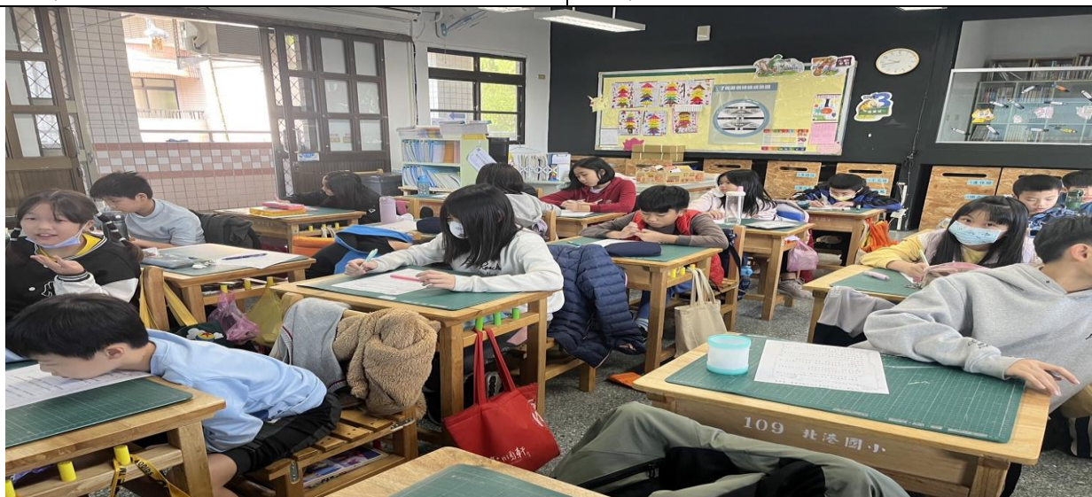
照片簡述： 分享家庭樹成員