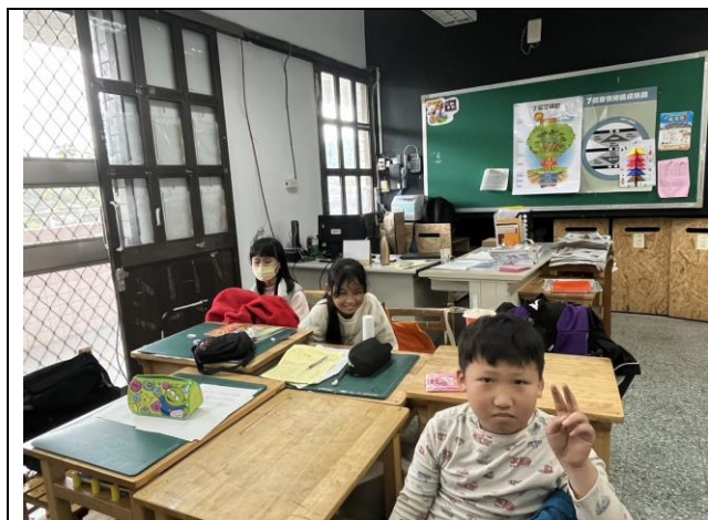
照片簡述：練習與不同性格的人相處