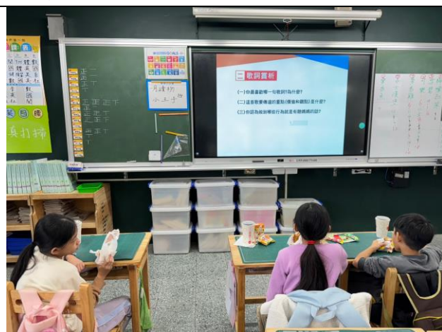
照片簡述： 賞析歌詞內容要表達的意涵。