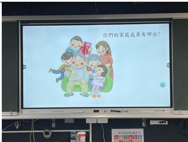
照片簡述： 由簡報呈現問題