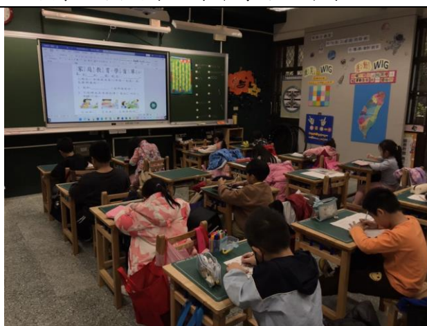
照片簡述：認真地完成學習單