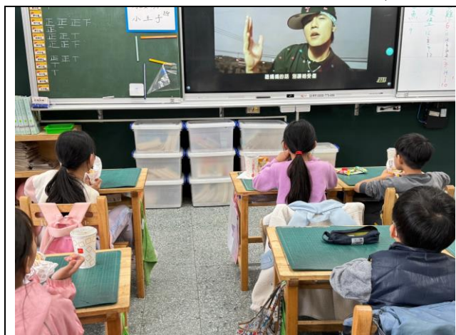
照片簡述： 帶學生聽歌曲『聽媽媽的話』。