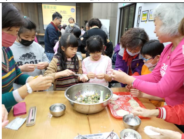
照片簡述： 學生與社區長輩共學