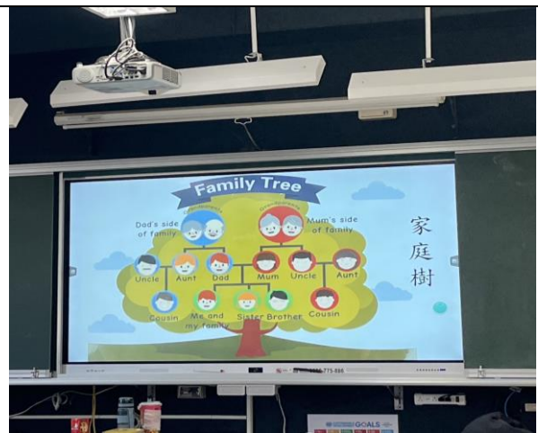
照片簡述： 由簡報呈現家庭樹