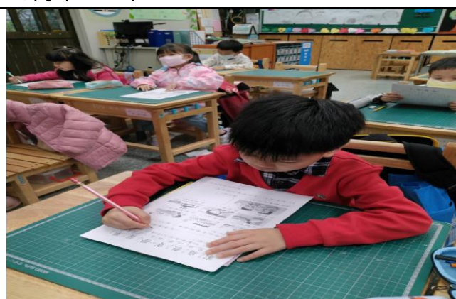
照片簡述：認真地完成學習單