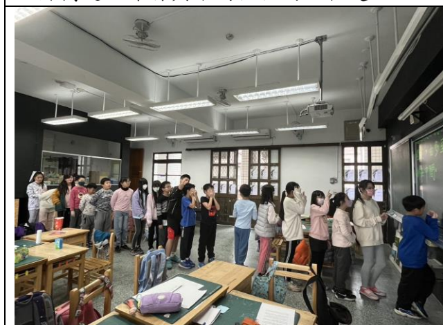
照片簡述：性格光譜