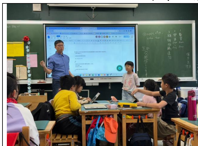
照片簡述： 學生於班上討論自己喜歡的職業