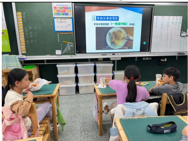
照片簡述： 讓學生觀看影片「一碗蛋炒飯」。