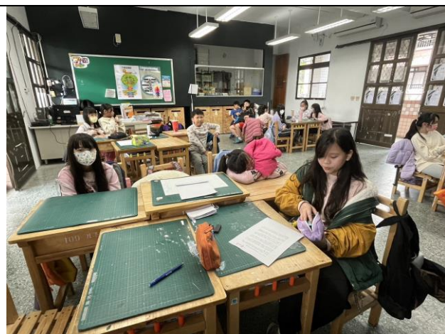
照片簡述：演示遇見不喜歡的人的第一反應