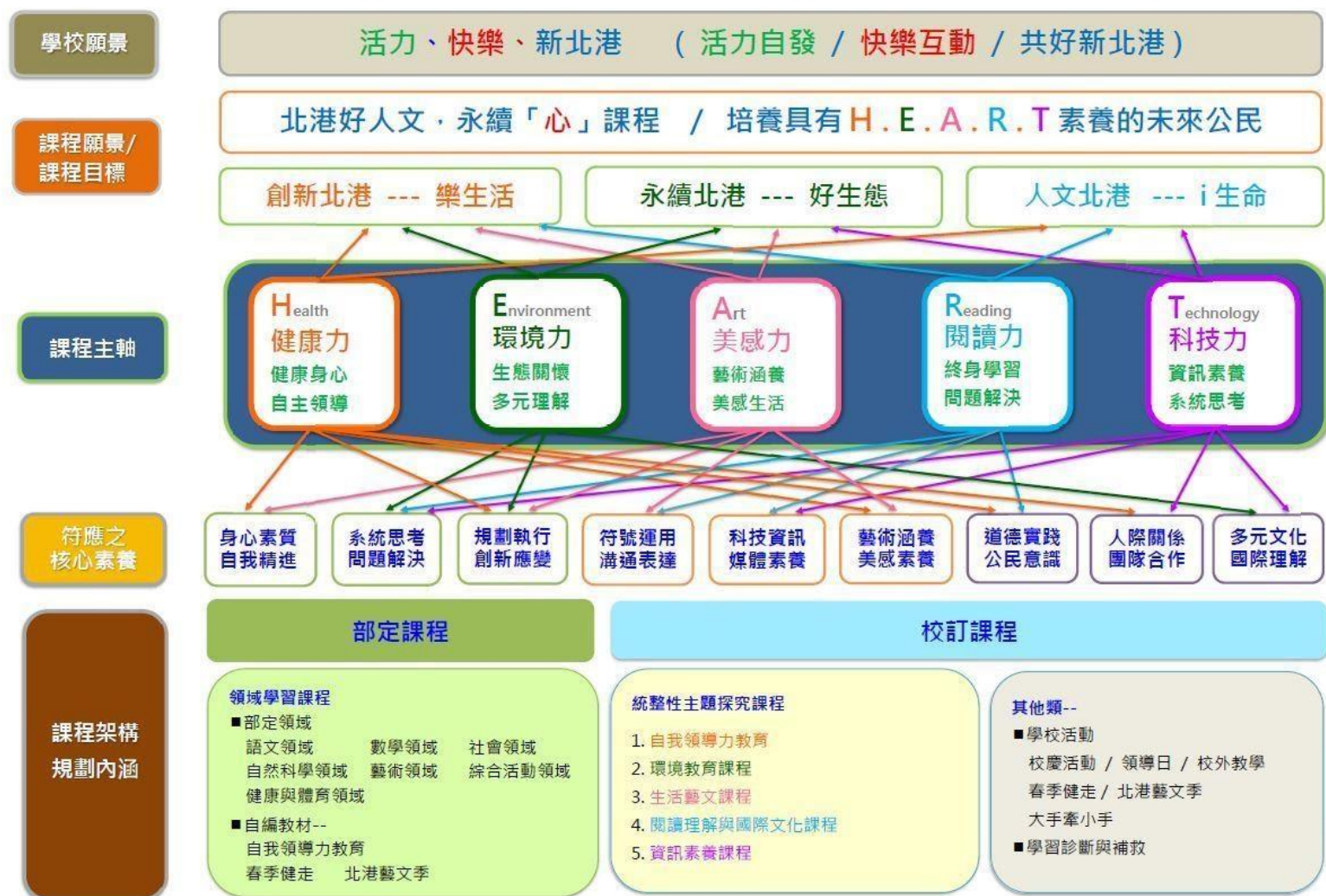
新北市汐止區北港國民小學課程總體架構圖