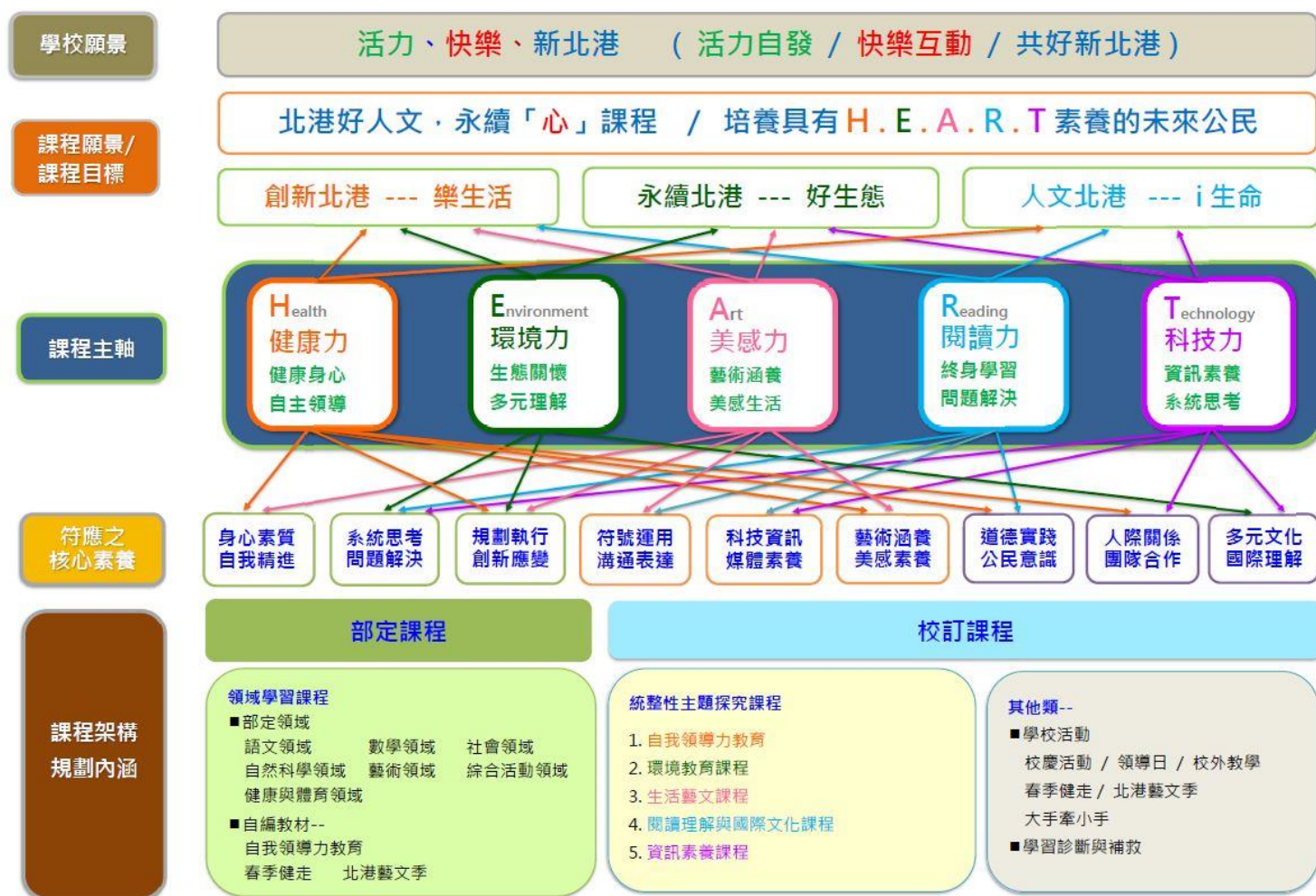
新北市汐止區北港國民小學課程總體架構圖