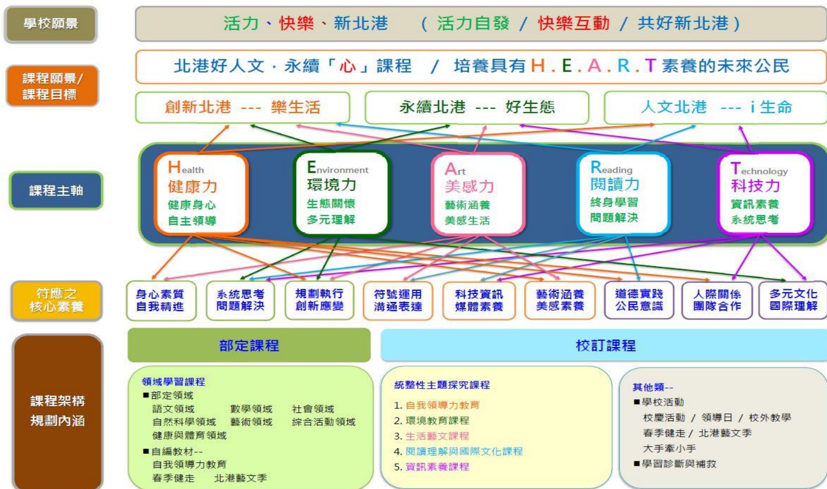
新北市汐止區北港國民小學課程總體架構圖